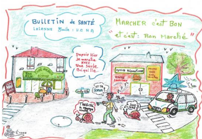
Emile nous envoie son bulletin de santé

Sacré Emile ! Faire le trottoir à ton âge, ce n'est pas raisonnable. Moralité : fracture du bassin. Tu fais causer dans les chaumières comme en témoignent quelques extraits des messages que tu as reçus.